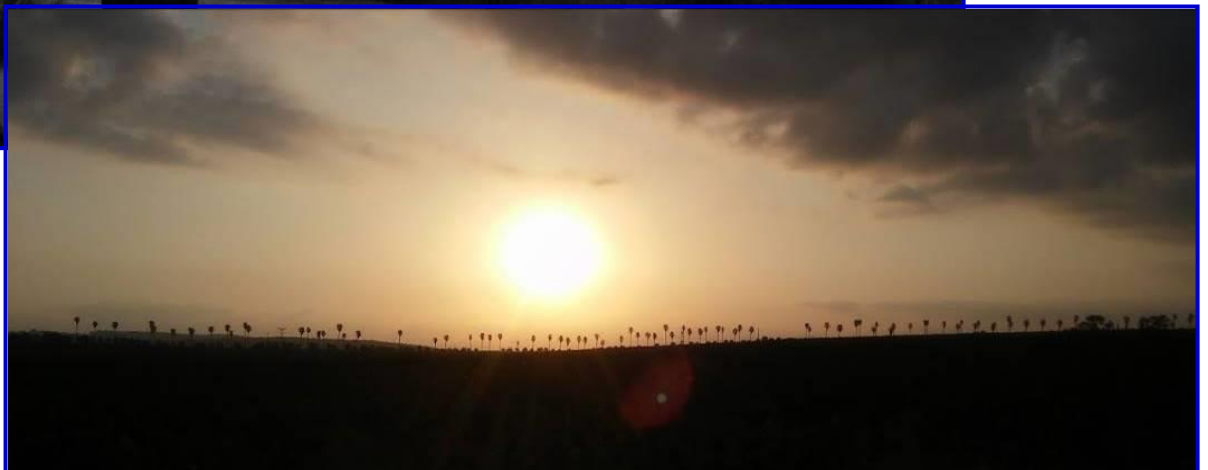
שבוע נפלא עדה ונורית פ.

כך נראות לאחרונה השקיעות והזריחות לאלה שנמצאים שם בשעות הנכונות